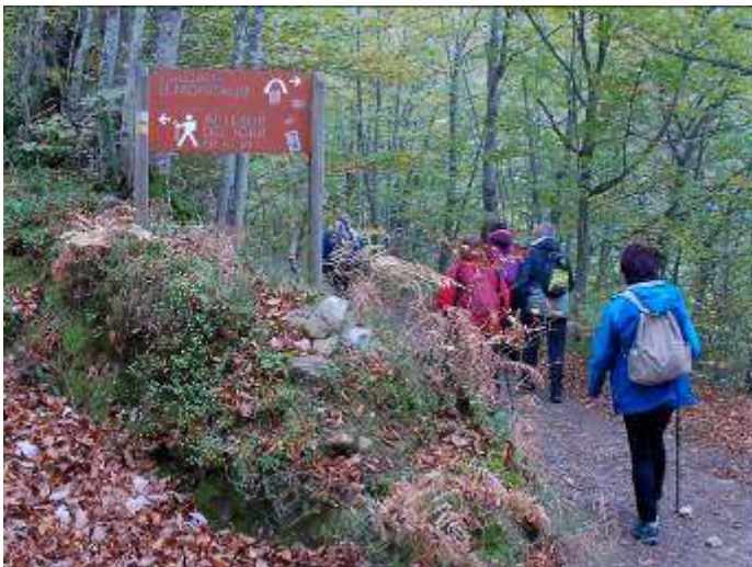
COORDENADAS 30 T317842 / 4775370 Altura: 1.107 m Firme : tierra

Aquí tenemos dos opciones para seguir con la ruta, la primera es dirigirse hacia la derecha y caminar hacia la cascada del Tabayon y la segunda es seguir por el camino de la izquierda y dirigirnos hacia los Roblones del Llano del Toro.