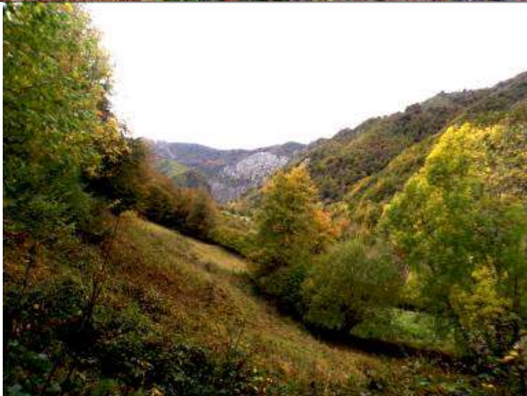
Poco a poco la pendiente se incrementa, pasando junto a una caseta de la traída de agua, llegando poco después al cruce de Terreros.