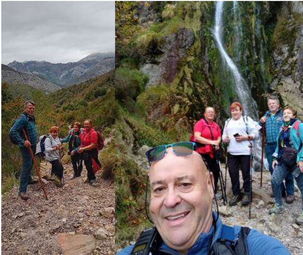
Para regresar unos optaron por volver por el mismo camino