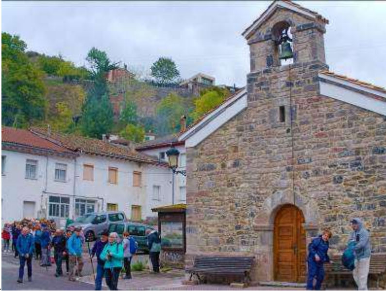
Punto 1 TARNA 0 m- 0 /0 min.

Iniciamos el recorrido a las 9,40 en el pueblo de Tarna, donde nos dejó el autobús, dirigiéndonos al fondo del pueblo donde empieza la ruta