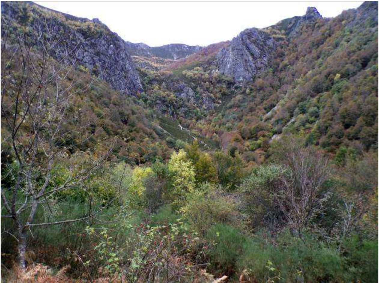
Desde este lugar vemos debajo de nosotros una campera donde se asienta la majada La Campona, a la que descendemos por un estrecho sendero.