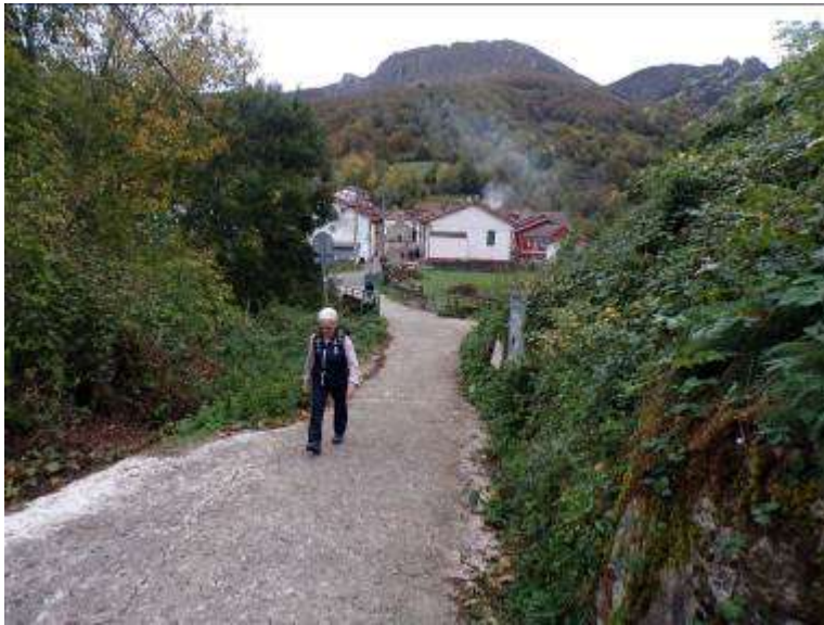
El camino se interna en un bosque donde el suelo esta totalmente cubierto por las hojas caídas de los arboles, yendo flanqueados por árboles y prados.