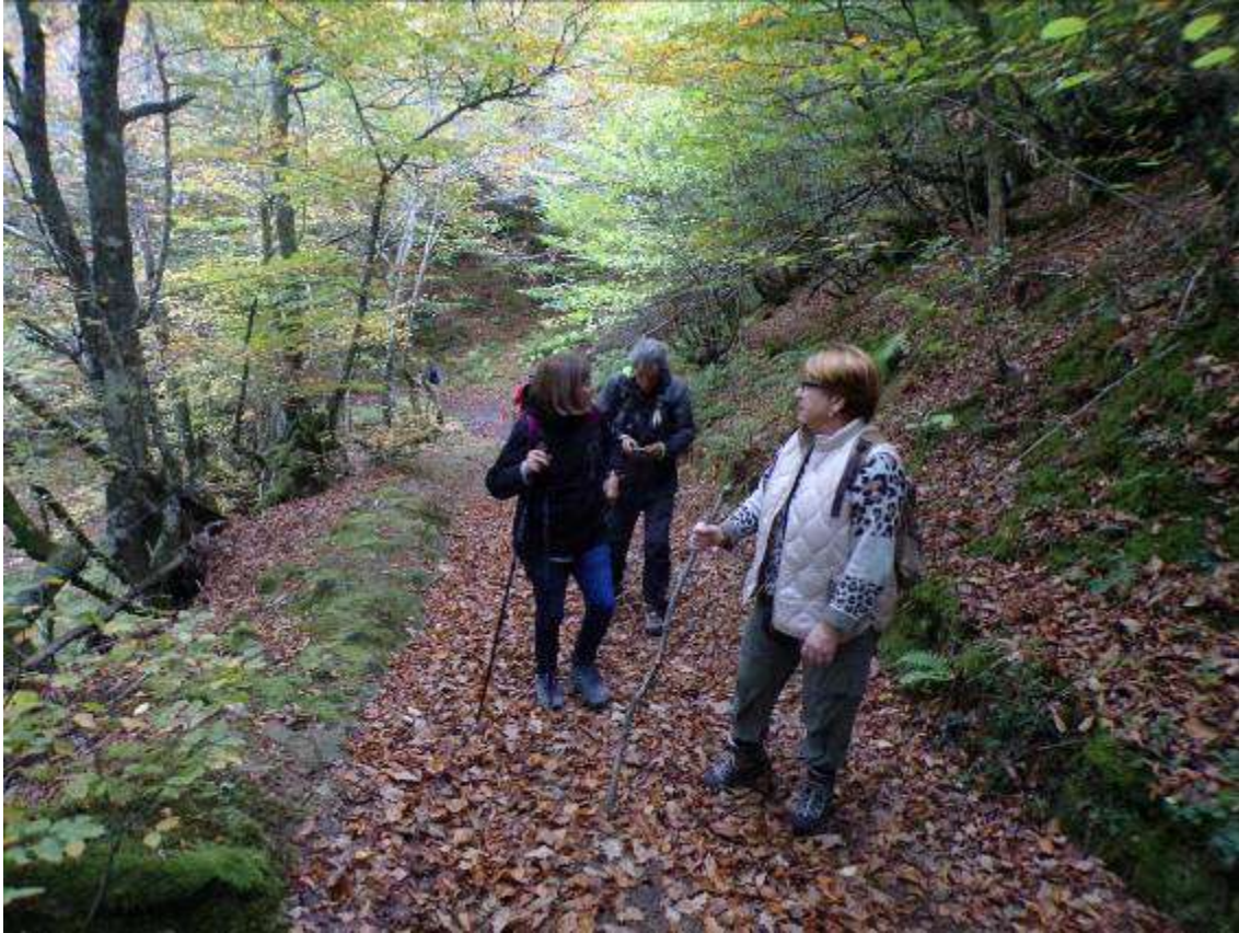
Punto 2 DESVIO TERREROS 1.055 m- 1.055 / 0 h 25 m