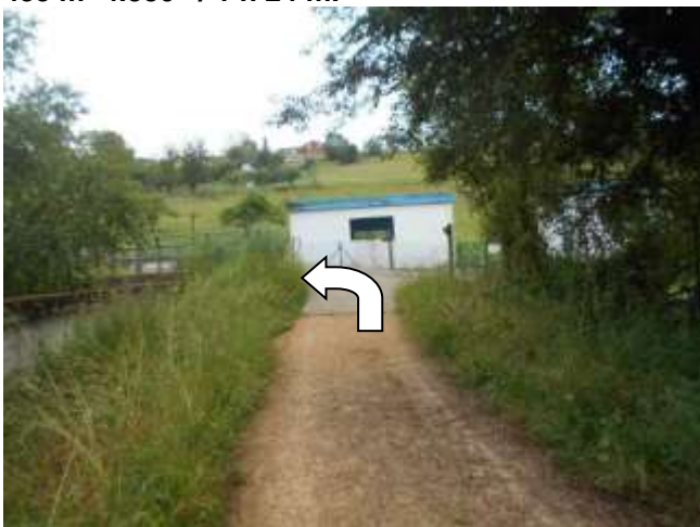
GPS: COORDENADAS 30T 262012/ 4823240 Altura: 104m Firme: asfalto

Al llegar a ella el canal se vuelve a introducir en un túnel llamada "Cruce Villa", y la toma de agua para Aviles. Aquí giramos a la izquierda, para dirigirnos hacia el Truebano..