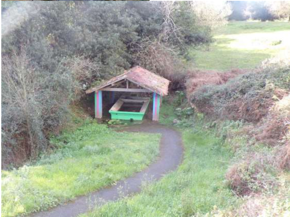
A los pocos metros nos encontramos con un sendero hormigonado que nos conduce a un lavadero restaurado, actualmente empezando a estar cubierto de maleza.