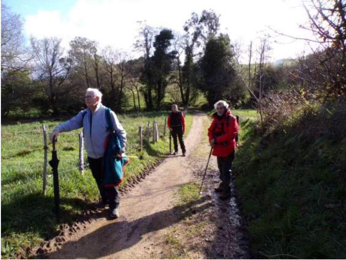
Punto 5 ARROYO CASAL 381m- 3.539 / 1 h 06 min