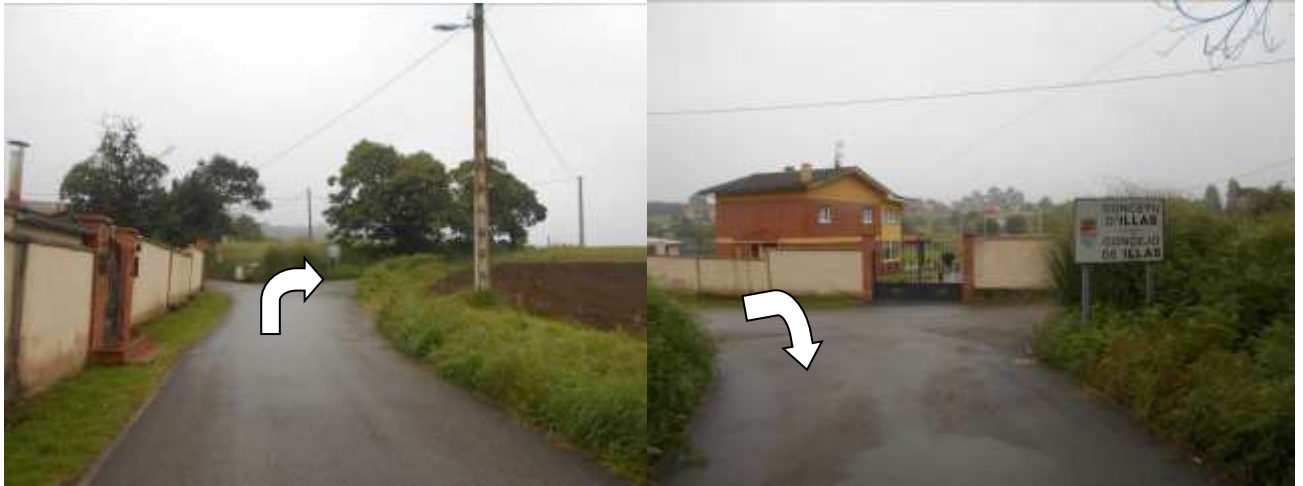
La carreterita asciende ligeramente entre prados, encontrándonos con otro de los múltiples hitos de piedra que nos indican los kilómetros recorridos.