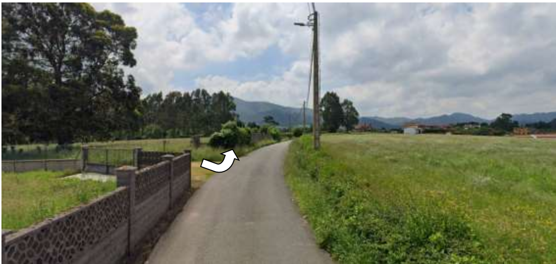
Punto 7 TUNEL CRUCE DE VILLA 435 m- 4.380 / 1 h 24 m.